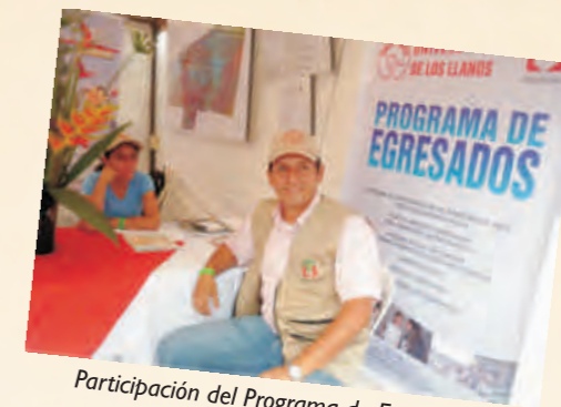
Participación del Programa de Egresados en la Feria de Catama 2010