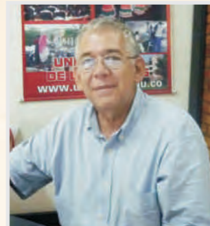
Por: Carlos Ariel Jiménez Obando Profesional en Gestión Institucional Dirección de Proyección - Unillanos

Los escombros son ya un problema en razón a que el municipio no ha escogido un sitio como escombrera y, en consecuencia, algunos ciudadanos los arrojan en cualquier parte: a orilla de las vías, el anillo vial y rondas de los caños. Es un problema que se espera solucionar este año con la revisión del POT y un estudio que está adelantando la Secretaría del Medio Ambiente que definirá el sitio y el operador para el manejo de los escombros.