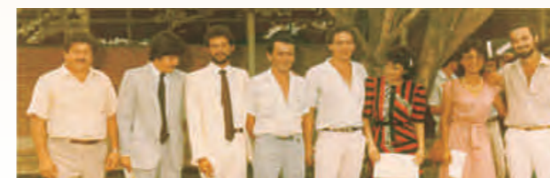
Primeros graduados del Programa de Ingeniería Agronómica.