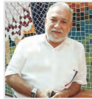
Por: Obed García Durán 2

En consecuencia, con la constitución de una facultad de estas características y sobre esta concepción de la producción, la Universidad inicia un racional proceso de