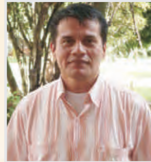
Por: Guillermo Ladino Orjuela Asociaciones de Egresados

Indicadores de impacto poco dicentes o ambiguos, la descontextualización de los egresados sumado a la escasez de oportunidades laborales son elementos que generan gran preocupación