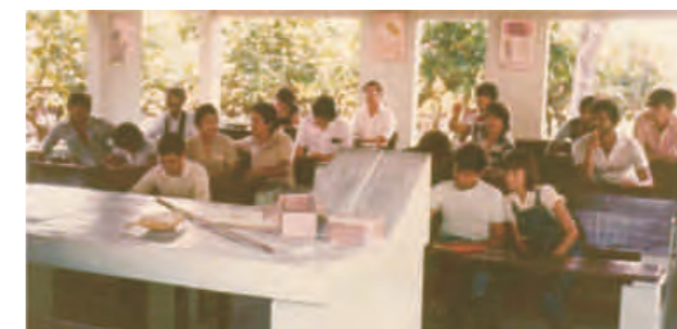
Inicio de clases en la sede Barcelona de la Unillanos.